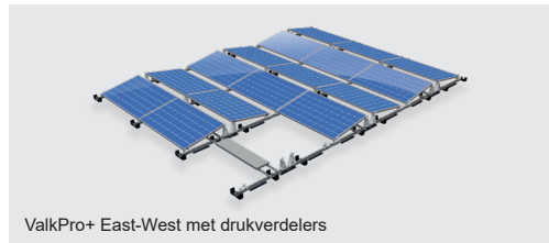
ValkPro+ East-West met drukverdelers